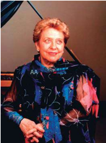
Alicia de Larrocha