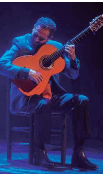
Diego del Morao

Carisma, talento y fresca caracterizan a esta pareja icónica dentro del ámbito flamenco.