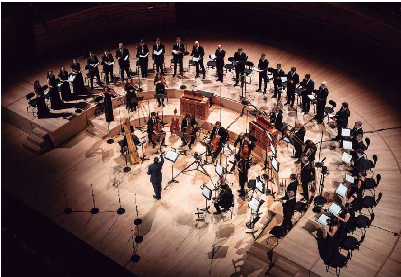
Cappella Mediterránea y Coro de cámara Namur