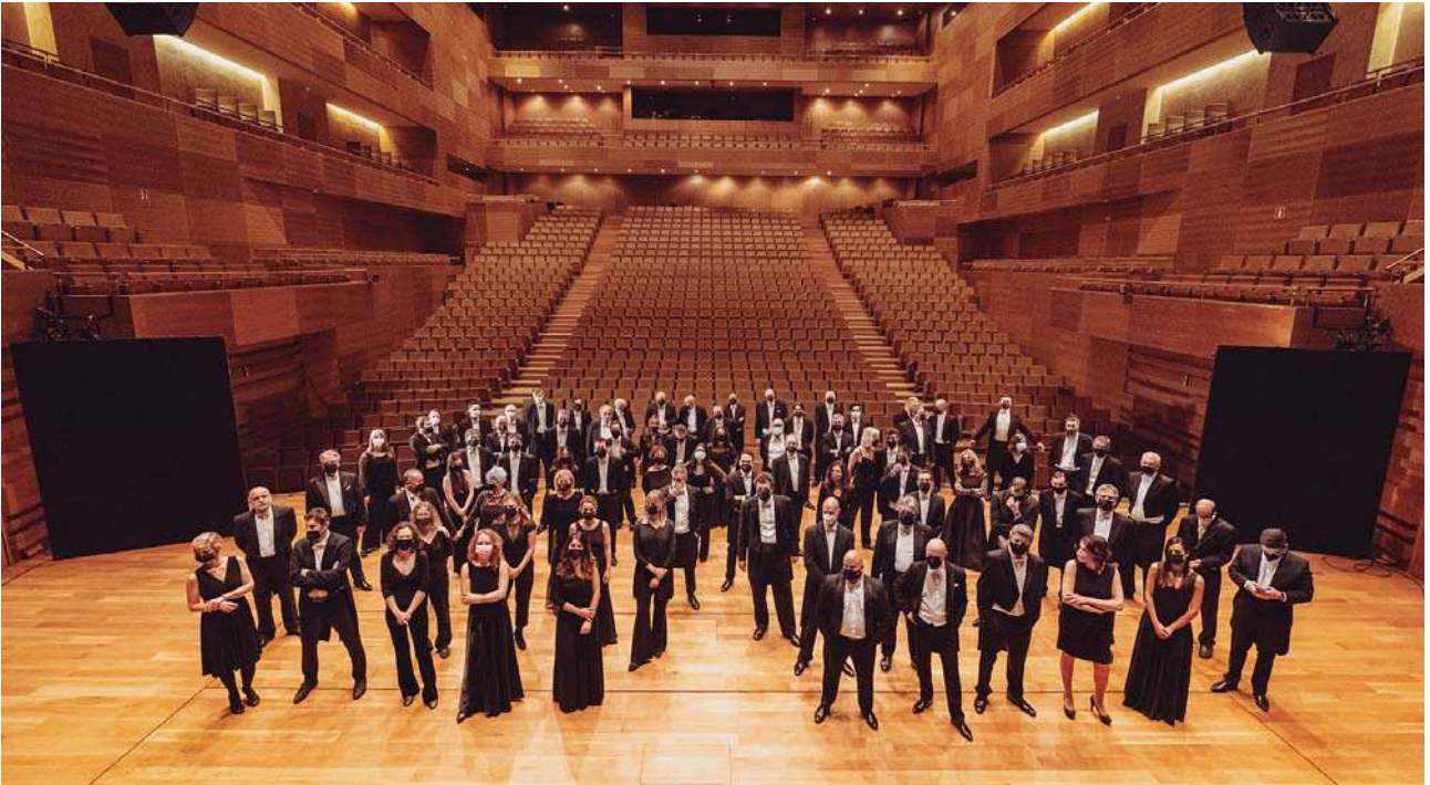
Orquesta Sinfónica de Castilla y León

Performance (PiP), Midori ha presentado conciertos de música de cámara por todo Estados Unidos, centrándose en comunidades más pequeñas que están fuera del radio centros urbanos más grandes y tienen recursos más limitados.