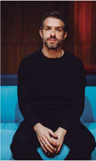
Omer Meir Wellber