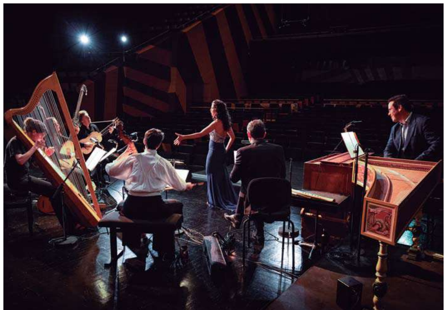
Cappella Mediterránea