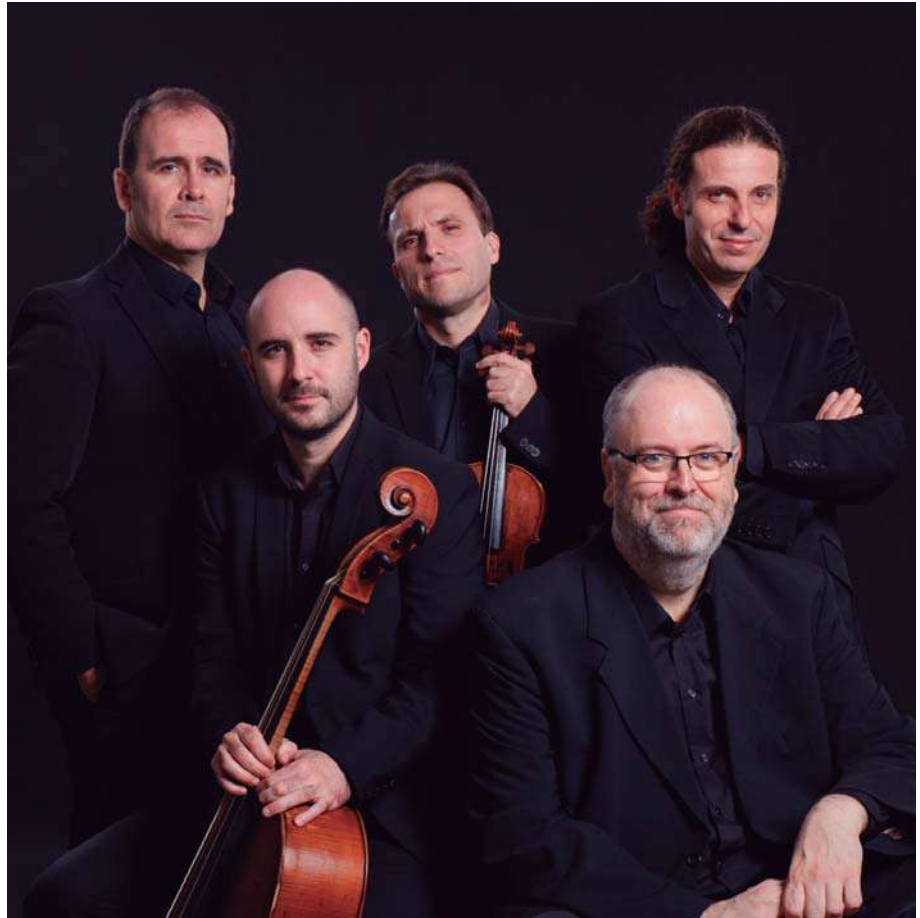
Al Ayre Español