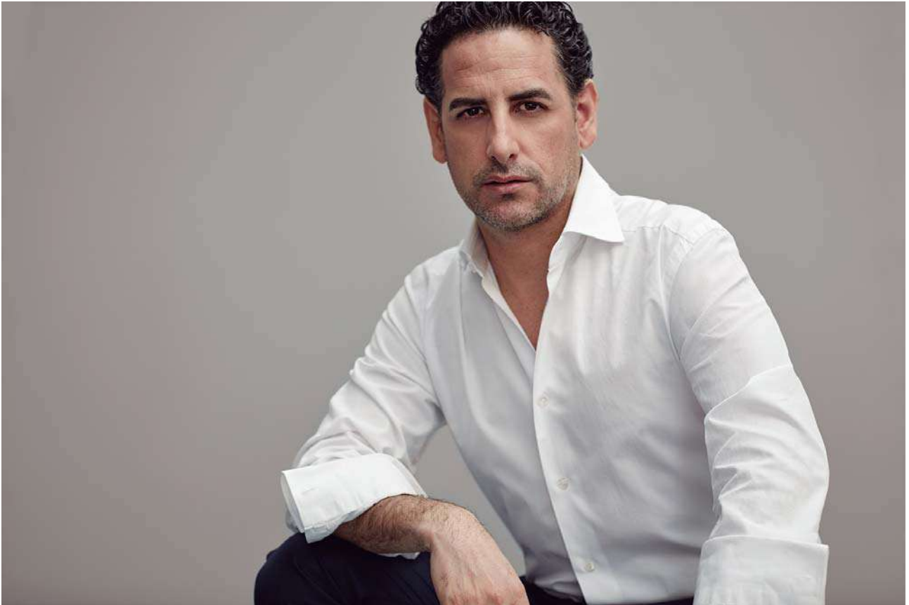
Juan Diego Flórez