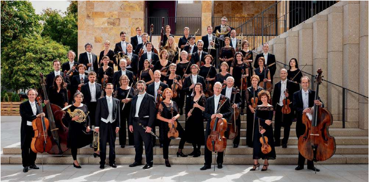
Deutsche Kammerphilharmonie

de 2018, dirigió el estreno del festival con Madama Butterfly de Puccini (BlueRay Opus Arte, 2019) en el Glyndebourne Festival, donde debutó en 2014 con la London Philharmonic Orchestra y su producción de Eugene Onegin . En marzo de 2017, dirigió el estreno de Andrea Chenier de Giordano en la Bavarian State Opera, donde ya había dirigido la nueva producción de Mefistofele en 2015 (DVD Unitel, 2016). En noviembre de 2016, dirigió la Sächsische Staatskapelle Dresden en el estreno mundial del oratorio On Love and Hate de Sofía Gubaidulina.