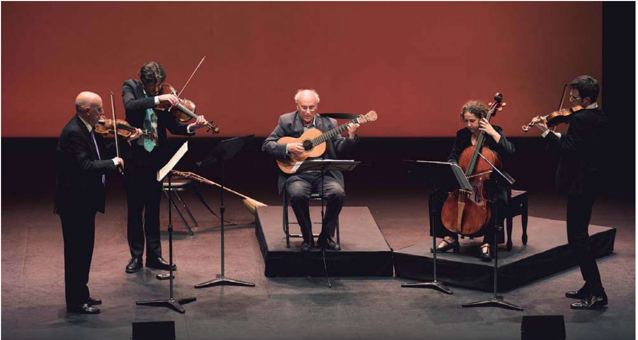
La Real Cámara

ensemble de cámara que pudiera interpretar ese valioso repertorio inédito, contando con un importante grupo de músicos nacionales, todos ellos individualmente reconocidos por su prestigio internacional y su enorme experiencia en la práctica histórica.