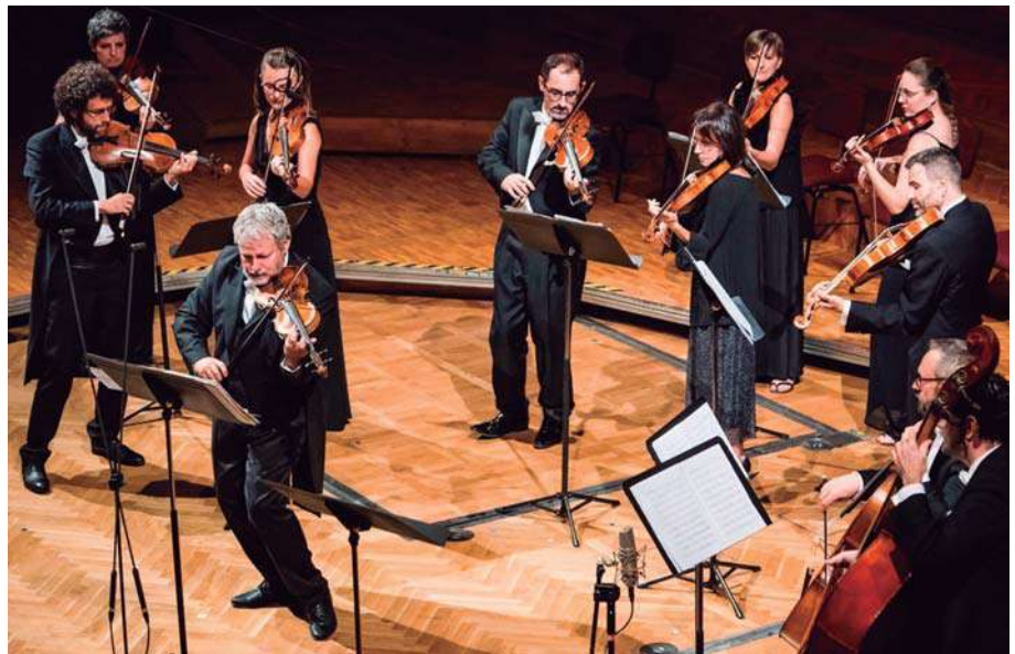
Europa Galante © Fabio Biondi

Ganadora del primer premio del Concurso de Ópera Barroca Cesti 2018 y del Concurso Internacional de Belcanto Vincenzo Bellini 2017, Marie Lys cantó bajo la dirección de Diego Fasolis, Laurence