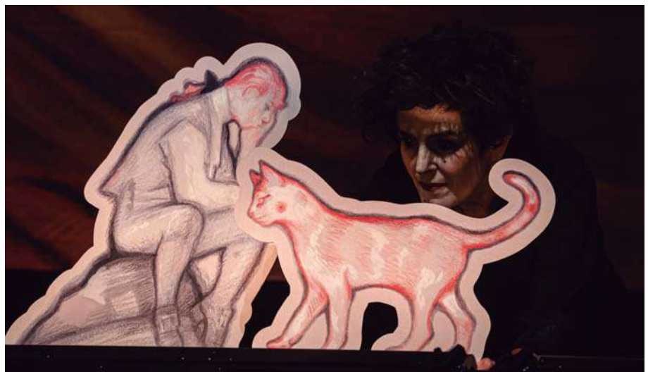
El gato con botas

El Gato con botas o Maese Gato es un cuento popular europeo recopilado en 1695 por Charles Perrault. Cuenta la historia de un gato que gracias a su astucia consigue la fortuna y la mano de una princesa para su amo, totalmente pobre. Desde su publicación, en 1697, en su libro Cuentos de antano , que dedicó y regaló a la sobrina de Luis XIV, tuvo muchísimo éxito.