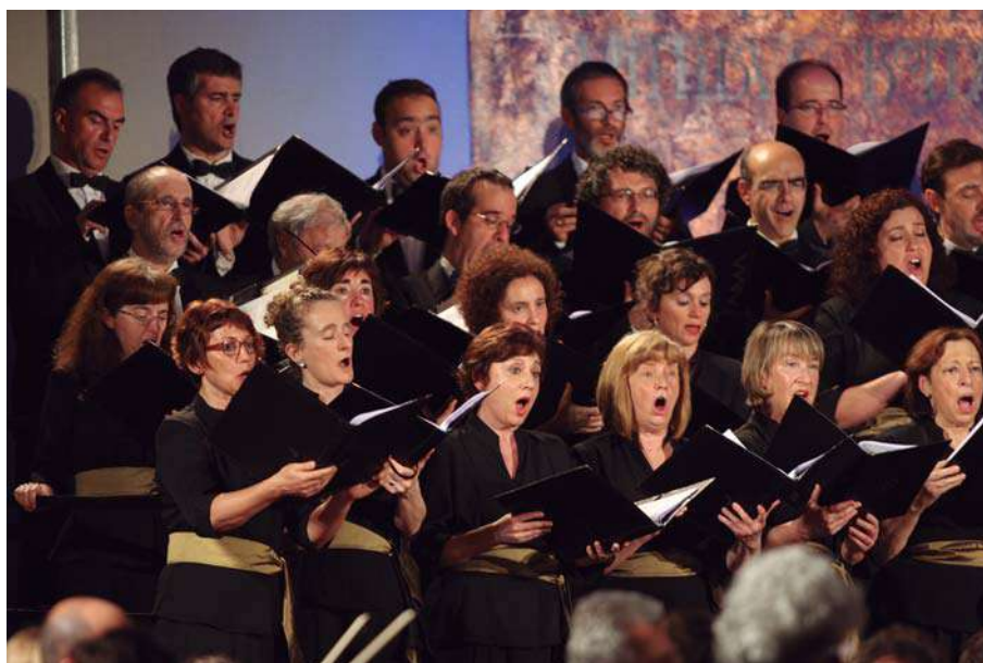
Coral Andra Mari