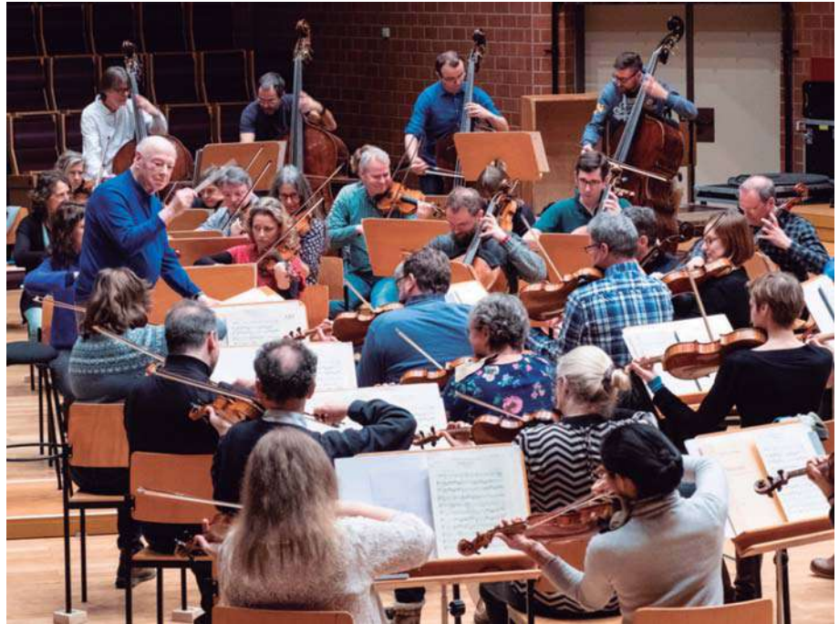
Chamber Orchestra of Europe

Garden, Die Entführung aus dem Serail en la Bayerische Staatsoper, Munich, Die Zauberflöte en el Wiener Festwochen y Wozzeck en el Theatre an der Wien. Estrechamente asociado con el Festival de Aix-en-Provence, ha dirigido nuevas producciones de Così fan tutte , Don Giovanni , La Traviata , Eugene Onegin y Le nozze di Figaro .