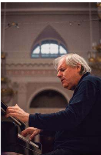
Grigori Sokolov